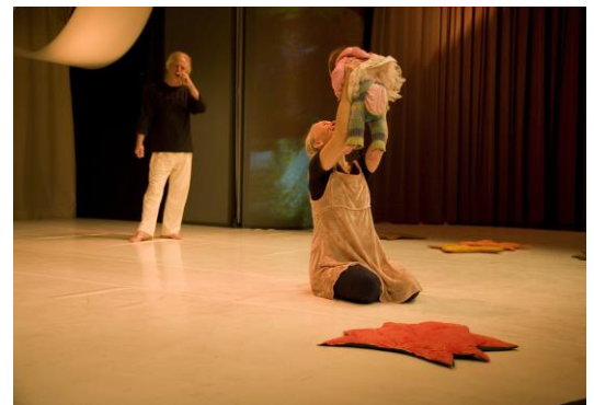
Kaikuja