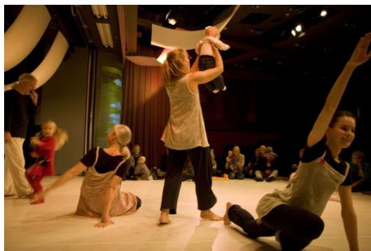
Kaikuja © Kia Oramo