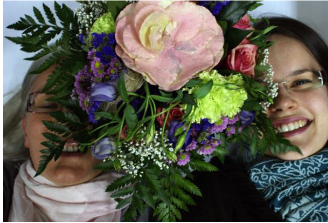
Esityksen jälkeen Chemnitzissä