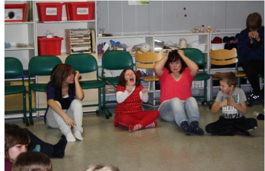
Olehyvämaassa © Outi Heinonen

Projektin vetäjinä toimivat Kuukulkurit ry:n jäsenet Tuula Vuorinen ja tekstiilityönopettaja Outi Heinonen sekä luokanopettaja Laila Hakkarainen..