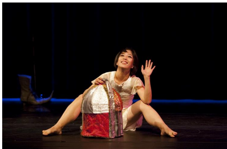
Kuuneiti © Daniel Alonso